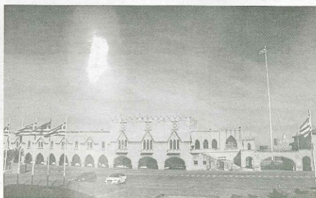
Αγροτική Ανάπτυξη, Εργασιακή και στις περιφέρειες, με αντίστοιχη ενίσχυση του προσωπικού (ή και με μεταφορά από τις αποκατεστημένες) να υπάρχουν ο στόχο επίτευξο, αποκατεστημένες κρατικές υπηρεσίες με αντικείμενα παρόμοια με τον Β' βαθμό Τοπικής Αυτοδιοίκησης.

Διαθέτει διεθνές αεροδρόμιο, έχει Πανεπιστήμιο και Ανώτερες σχολές, είναι πολιτισμικός κόμβος, με σημαντική υπερχρο και συμβολή στην Εθνική Οικονομία. Και το σπουδαιότερο, γενεαλογικά αποτελεί εθνικό και ευρωπαϊκό σύνορο. Πουσιών στην Ελλάδα δεν υπάρχει έδρα περιφέρειας σε μικρότερο αστικό κέντρο, παρά